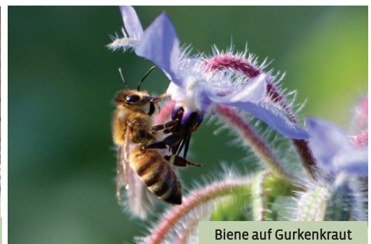
Biene auf Gurkenkraut