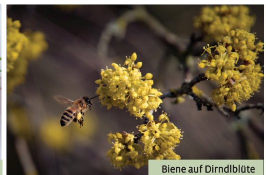
Biene auf Dirndlblüte