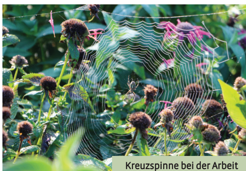
Kreuzspinne bei der Arbeit